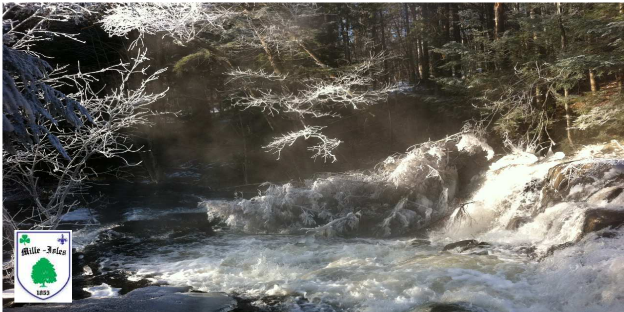
Ruisseau Bonniebrook à l'affluent du lac Dawson – Mille-Isles

La création de ce comité est donc un bel exemple à suivre pour les municipalités des Laurentides. Il s'agit d'une action intéressante permettant de susciter l'intérêt et la collaboration des gens du milieu dans l'élaboration de nouvelles orientations pour la gestion du territoire municipal.